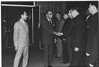
Tengku Razaleigh, Allabyarbam Tun Razak dan pemimpin-pemimpin China di Peking.