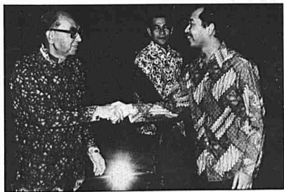
Tengku Razaleigh menyambut ketibaan Tun Razak di Kuala Lumpur.