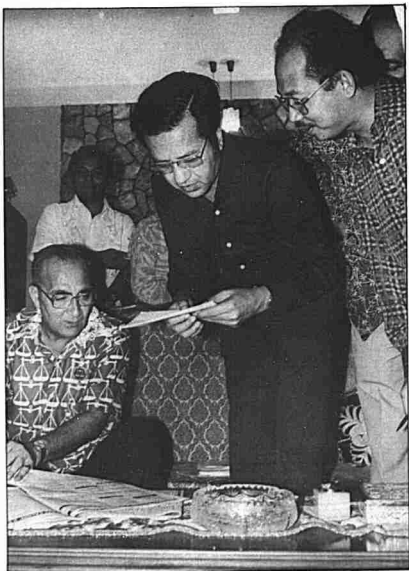
Menyemak keputusan pilihanraya Parlimen 1978 bersama Tun Hussein Onn dan Dr. Mabathir.