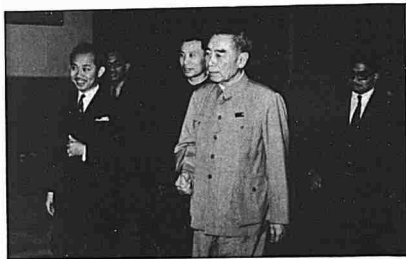
Tengku Razaleigh bersama mendiang Chou En Lai, Perdana Menteri China di Peking, 1971.