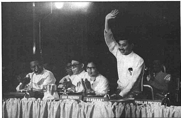
Tengku Razaleigh selepas dilantik sebagai timbalan presiden UMNO dalam tabung 1974.