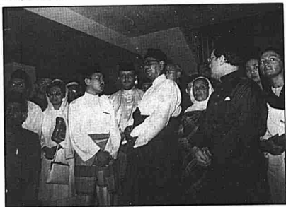
Tengku Razaleigh dan Tunku Abdul Rahman memberi pengbormatan terakbir kepada Allahyarbham Tun Razak.