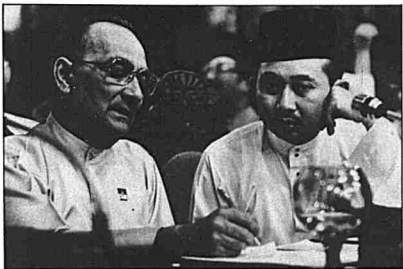
Tengku Razaleigh sebagai timbalan presiden kanan, dalam perbincangannya dengan Tun Hussein Onn.