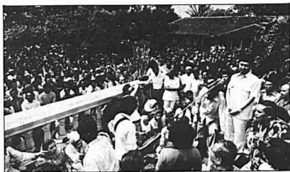
Tengku Razaleigh menjelaskan kekalahan beliau dalam pilihanraya parti 1981 kepada para pengundi di Kota Bharu.