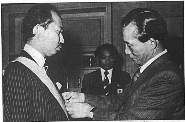
Di upacara penerimaan pingat kebangsaan Korea Selatan daripada bekas Presiden Park Chung Hee.