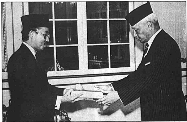
Penyerahan Laporan Ekonomi kepada DYMM Sultan Pabang iaitu Yang di-Pertuan Agong yang ketujuh