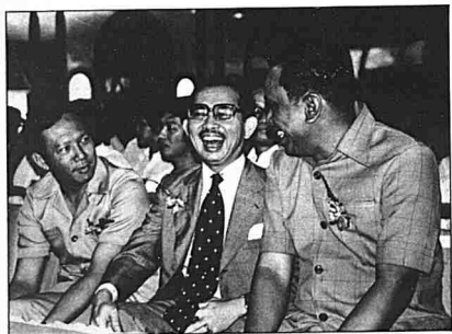
Bersama Dato' Musa Hitam (sebelah kiri) dalam tabun 1977.