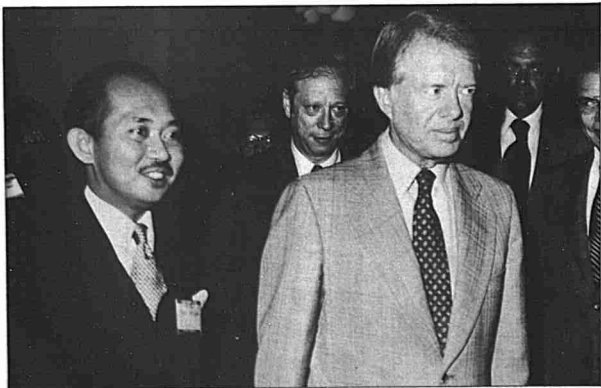
Tengku Razaleigh bersama bekas Presiden Amerika, Jimmy Carter di perjumpaan Bank Dunia di Washington.