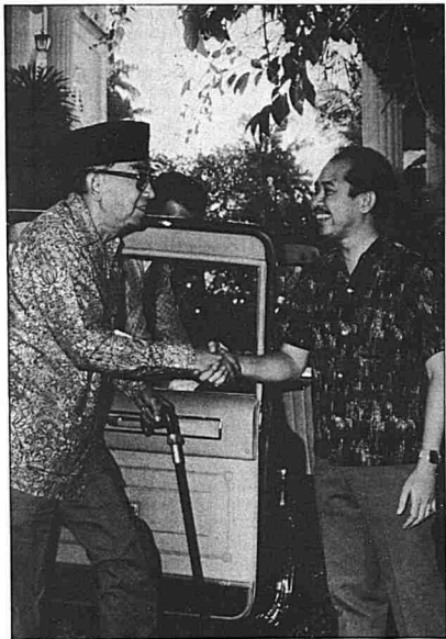
Tengku Razaleigh bersama penasibat, Allabyarbam Tun Razak.