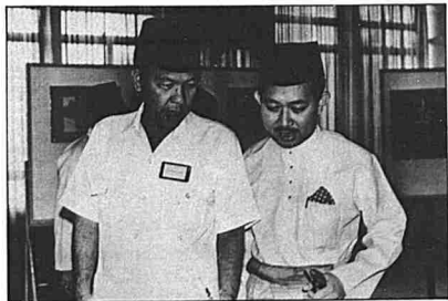
Tengku Razaleigh bersama Dato' Harun Idris.