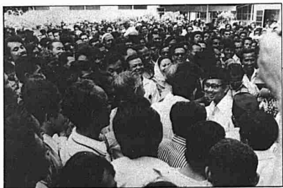
Tengku Razaleigh dikerumuni oleh para penyokong setelah berjaya menewaskan PAS dalam Pilihanraya 1978.