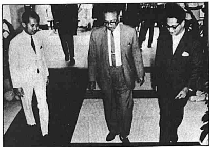
Tengku Razaleigh bersama Tunku Abdul Rahman.