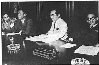
Tengku Razaleigh bersama bekas pemimpin Pertamina, Ibnu Sutowo.