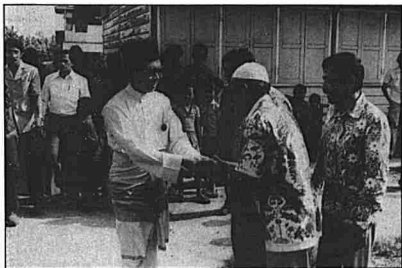
Tengku Razaleigh bersama para pengundi.