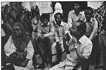
Tengku Razaleigh bersama para pengundi di Palm Manor, Kota Bharu.