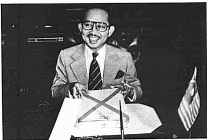
Tengku Razaleigh menandatangani Belanjawan 1977/78.