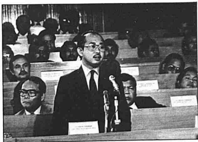
Tengku Razaleigh membentangkan Belanjawan di Parlimen.